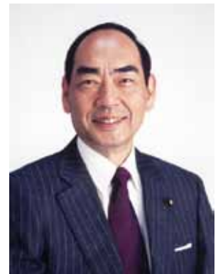
元衆議院議員 白井日出男

つまり、日本がいくら相手を“平和を愛する国や地域”と善意に解釈しても、現実を直視すれば、そうした善意が全てに通用するとは考えられないのだ。日本の安全や生存を日本サイドで勝手に“平和を愛する諸国民”と断じてみても、これでは我々の大切な日本は守れないことは明らかである。憲法の大前提である前文から誤っている日本国憲法を一日も早く改め、しっかりと日本の安全と平和を守れる憲法を創るべきと考えるのは私だけだろうか。