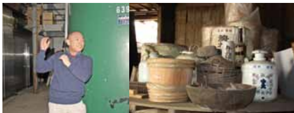
地酒舞桜の守屋酒造社長