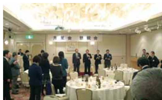
日の出の男を合唱