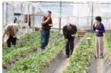
藤井いちご園での味比べ

今年の「春の宴」は「バスで行くミステリーツアー」と題して行き先、内容共に明かさずに出発するというユニークな企画を行いました。